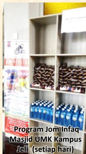
Program Jom Infaq Masjid UMK Kampus Jeli (setiap hari)