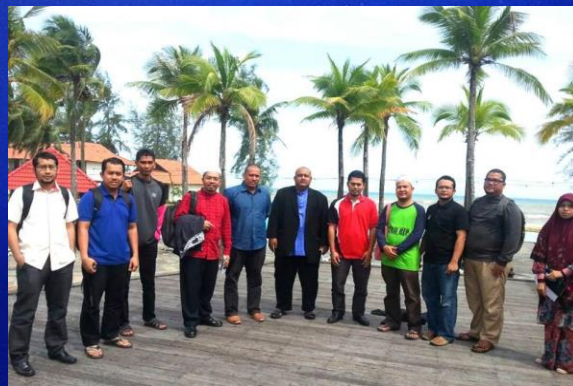
Bengkel Hala Tuju & SKT Pusat Islam 2018