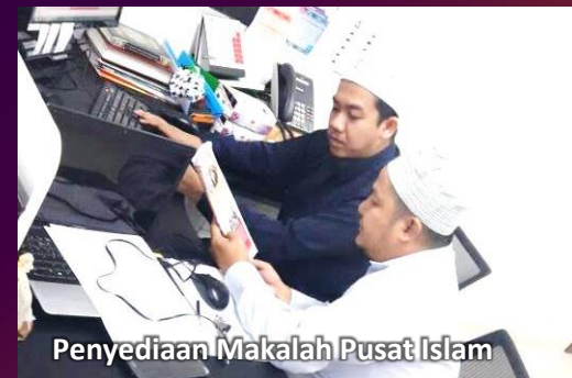
Penyediaan Makalah Pusat Islam