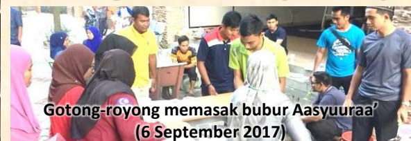
Gotong-royong memasak bubur Aasyuura' (6 September 2017)