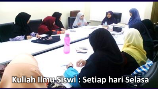
Kuliah Ilmu-Siswi : Setiap hari Selasa