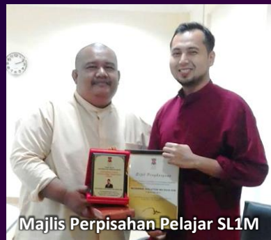
Majlis Perpisahan Pelajar SL1M