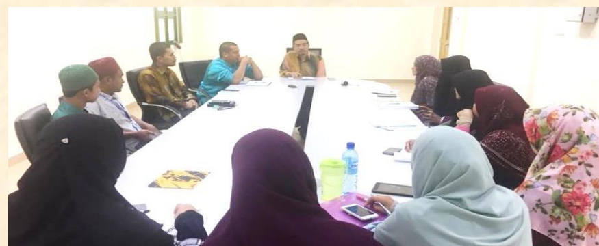
Perjumpaan bersama Jawatankuasa Teman UMK (16 November 2017)