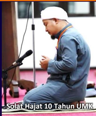
Solat Hajat 10 Tahun UMK