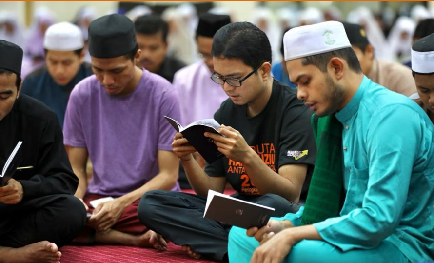
Majlis Bacaan Yaasin & Solat Hajat 10 Tahun UMK (30 November 2017)