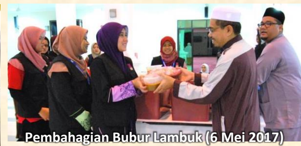
Pembahagian Bubur Lambuk (6 Mei 2017)