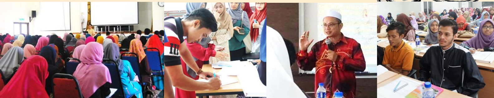
SEKITAR KURSUS PRA PERKAHWINAN KAMPUS KOTA (11 & 12 Oktober 2017) DAN BACHOK (10 & 11 Mac 2017)