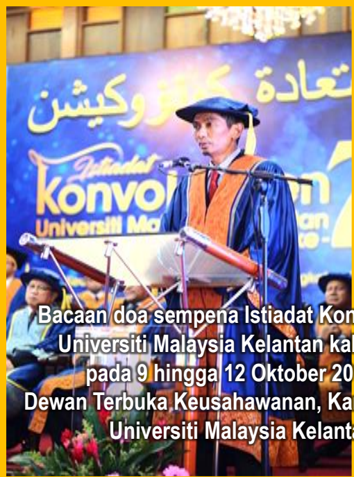
Bacaan doa sempena Istiadat Konvokesyen Universiti Malaysia Kelantan kali Ke – 7 pada 9 hingga 12 Oktober 2017 di Dewan Terbuka Keusahawanan, Kampus Kota, Universiti Malaysia Kelantan