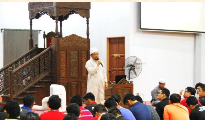
Slot Kerohanian Minggu Mesra Mahasiswa di UMK Kampus Jeli (7 September 2017)