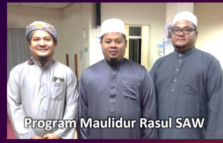
Program Maulidur Rasul SAW