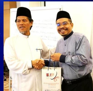
Bengkel Strategik Wakaf@UMK