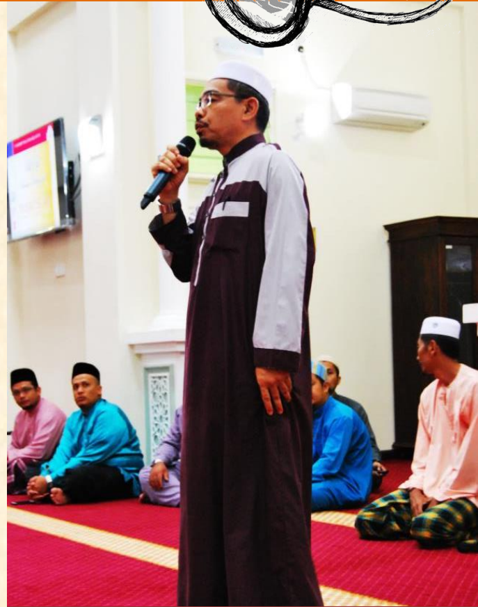
Ucapan Pengarah dalam sesi bersama pelajar baharu di Kampus Bachok (6 September 2017)