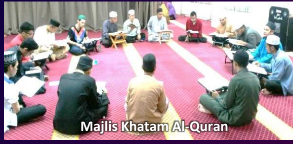
Majlis Khatam Al-Quran