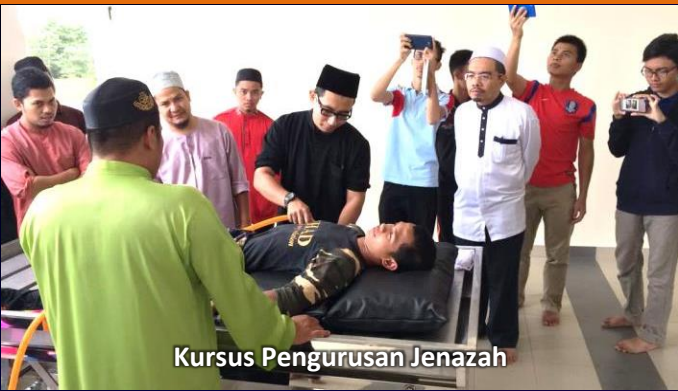
Kursus Pengurusan Jenazah