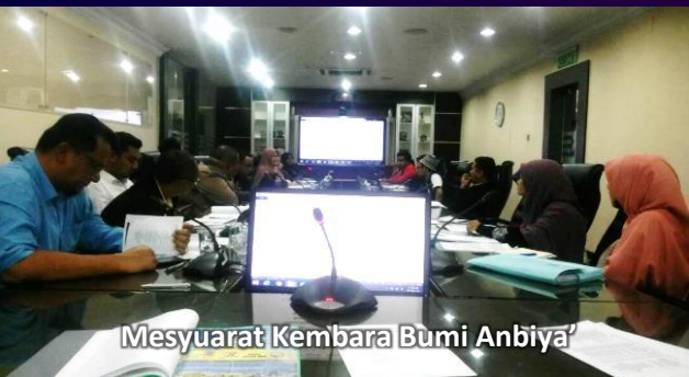
Mesyuarat Kembara Bumi Anbiya'