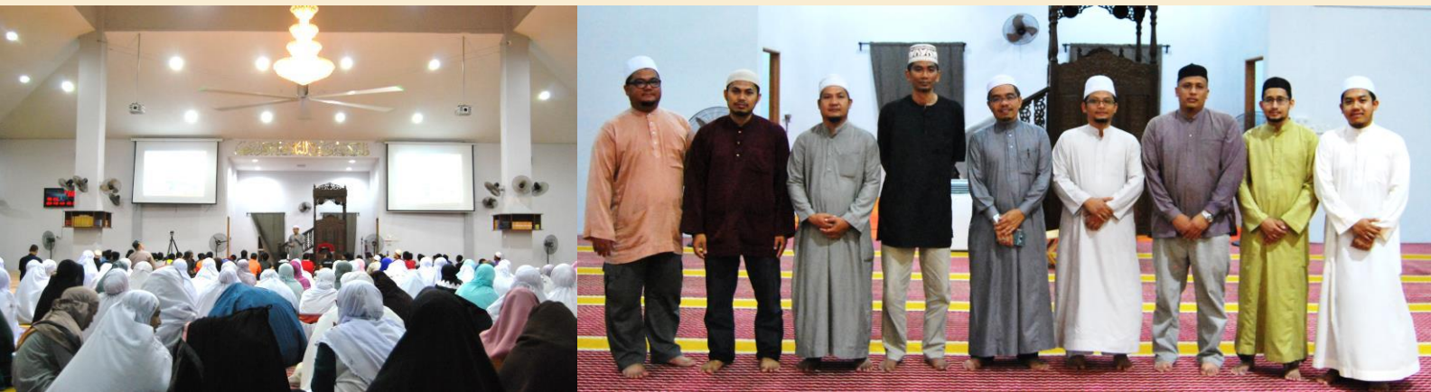
SEKITAR SLOT PUSAT ISLAM BERSAMA PELAJAR BAHARU SESI 2017/2018 DALAM MINGGU MESRA MAHASISWA (3M)