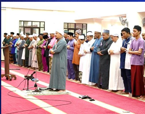
Solat Hajat 10 Tahun UMK